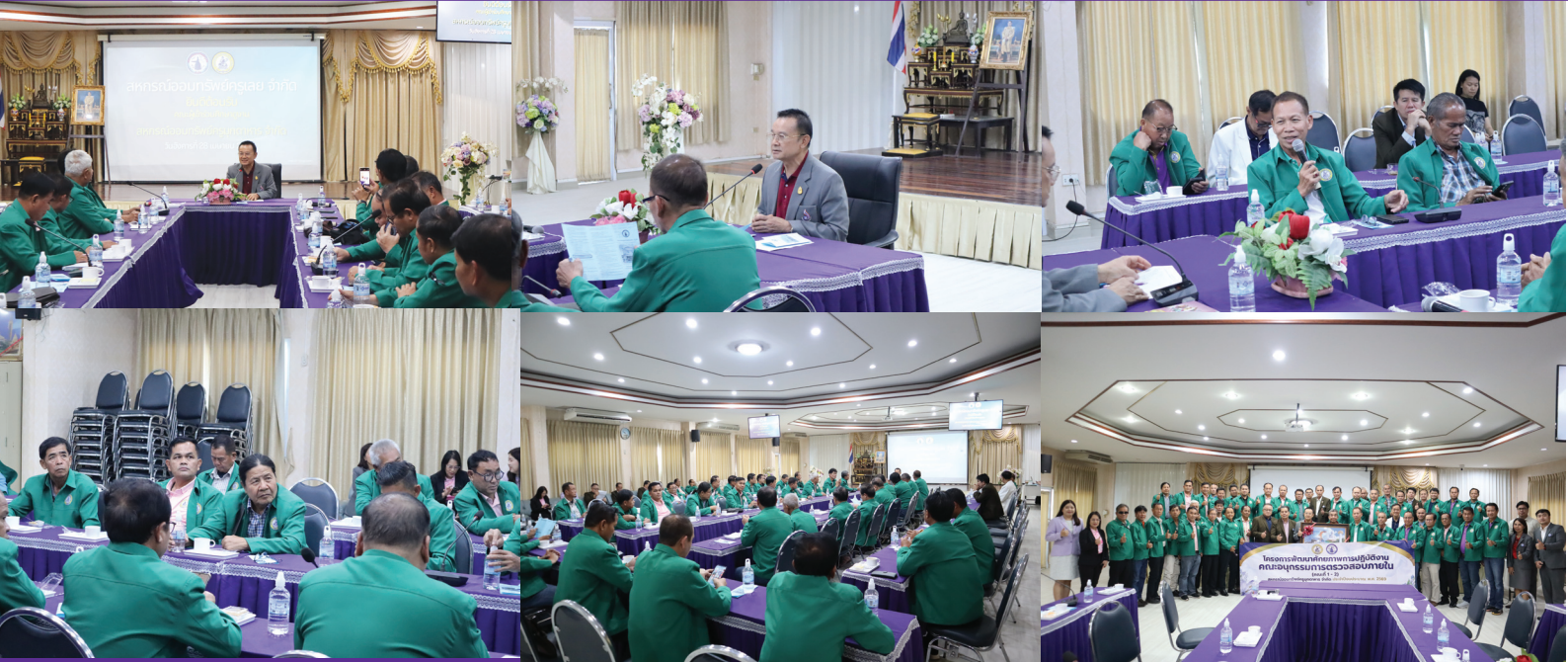
โครงการสัมมนาหลักสูตร “การพัฒนาโครงการให้บริการสินเชื่อให้แก่สมาชิกอย่างมีความรับผิดชอบ” โดย ชมอ. วันที่ 6 - 8 พฤษภาคม 2569