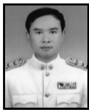
( ส.อ.มงคล สรนวล ) กรรมการ